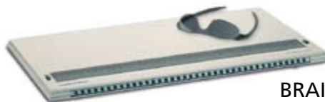
BRAILLEX EL 80s