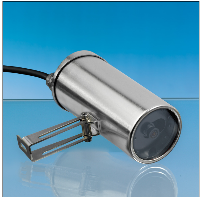
VISULEX Kamera K15-P-E mit Festobjektiv