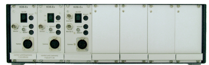
6fach Kamera-Rack mit drei Kamera-Steuer-Einschüben bestückt