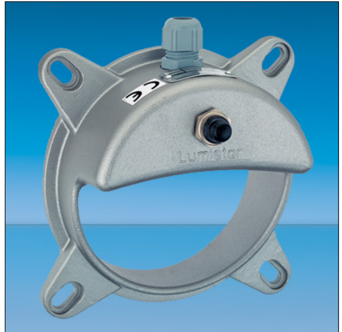
Lumiglas Leuchte Lumistar 225-LED