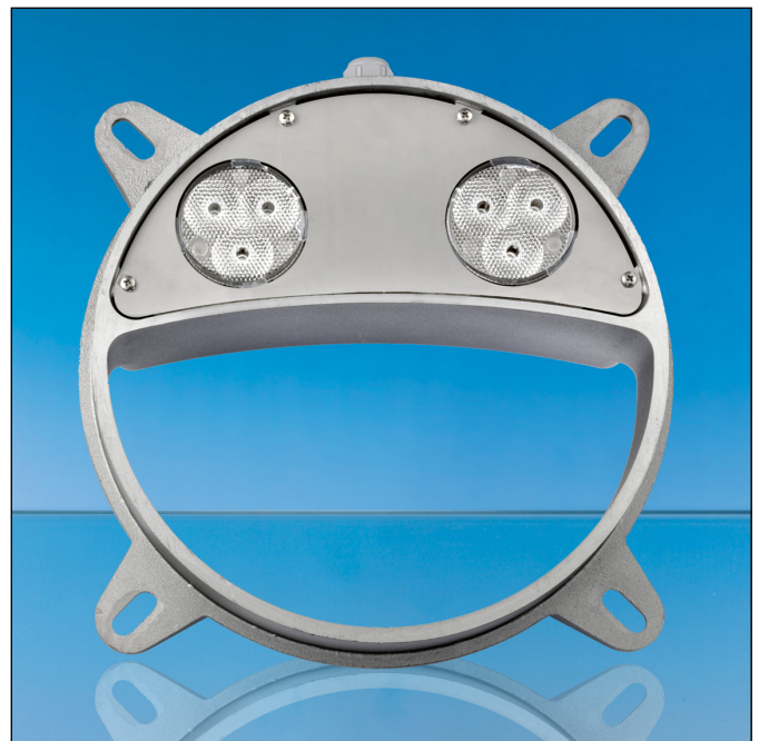
Lumiglas Leuchte Lumistar 225-LED