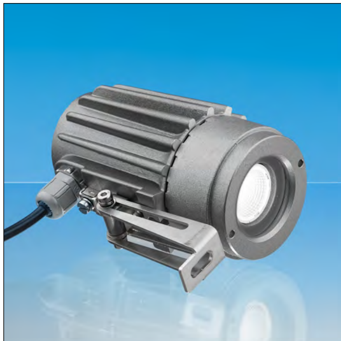
Lumistar Leuchte USL 05 LED (24 V)