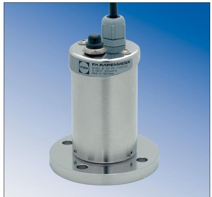
Lumistar Leuchte USL 35 befestigt auf einem Steriltechnik-Schauglas BioControl

Falls die Bestellung/Lieferung ohne Einbautaster erfolgt, ist unbedingt ein Moment-Taster oder Zeitschalter (Timer) außerhalb der Leuchte in die Stromversorgungsleitung zu setzen! In keinem Fall dürfen die maximal zulässigen Temperaturen an der Leuchte überschritten werden.