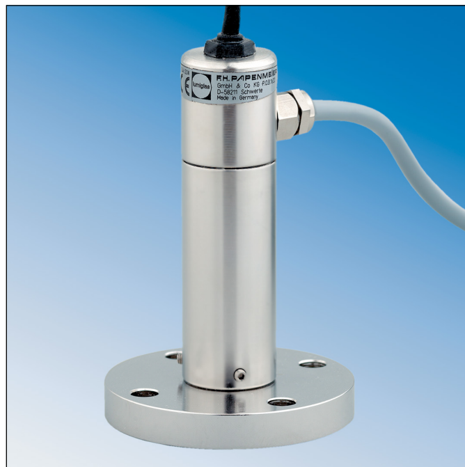
Mini Lumistar Leuchte USL 31 adaptiert für BioControl

Transformatoren für 12 V oder 24 V Sekundärspannung auf Wunsch lieferbar.