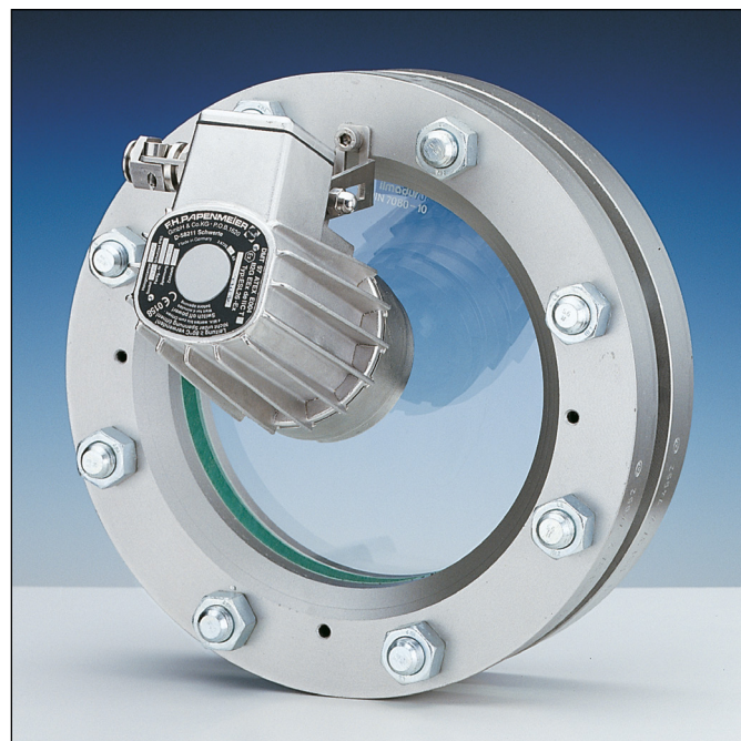
Einsatz als Kombination von Sicht- und Lichtglas auf einer Schauglas-Armatur nach DIN 28120, Montage über Klappscharnier