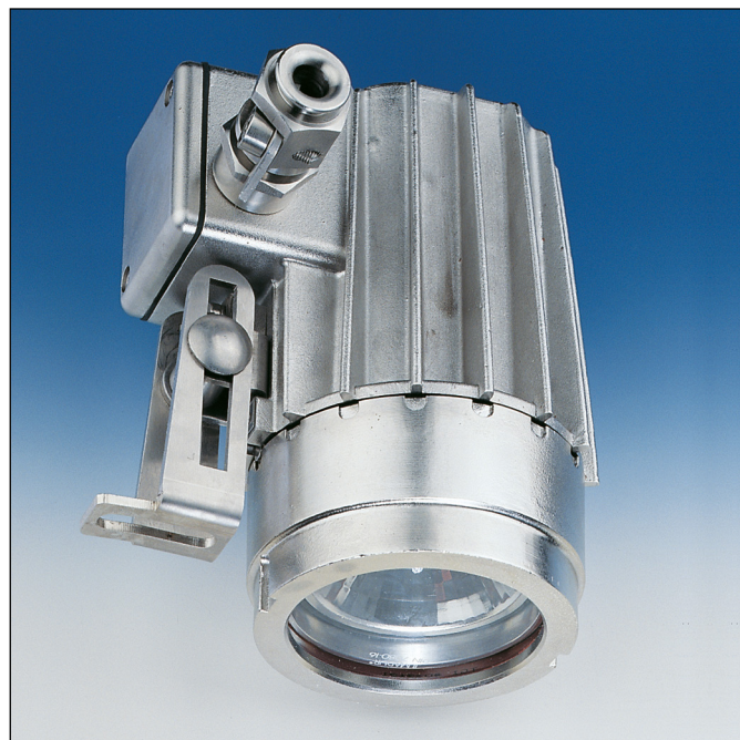
Lumistar Leuchte ESL 26, Edelstahl mit integriertem Anschlusskasten Klappscharnier