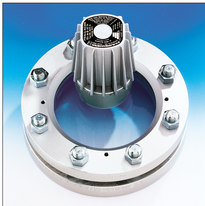
Einsatz als Kombination von Sicht- und Lichtglas auf einer Schauglas-Armatur nach DIN 28120, Montage über Klappscharnier