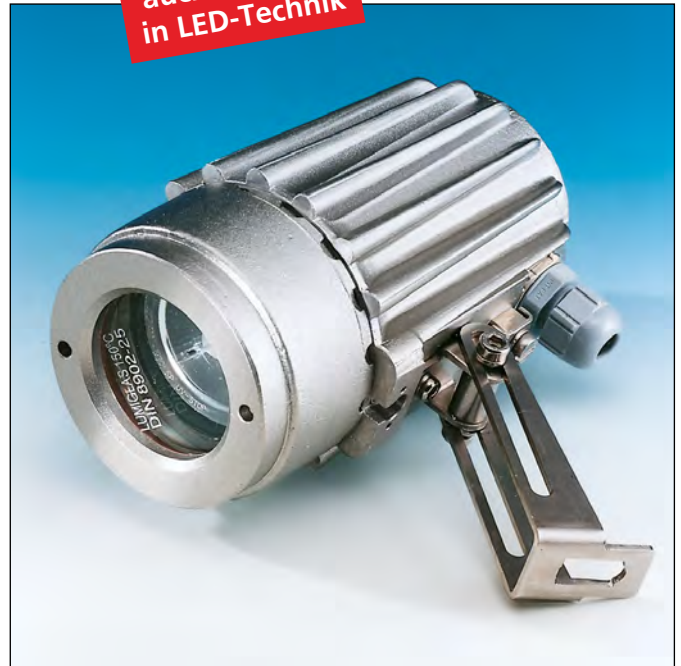
Lumistar Leuchte USL 05