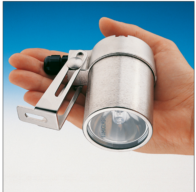
Lumistar Leuchte USL 03 aus Edelstahl