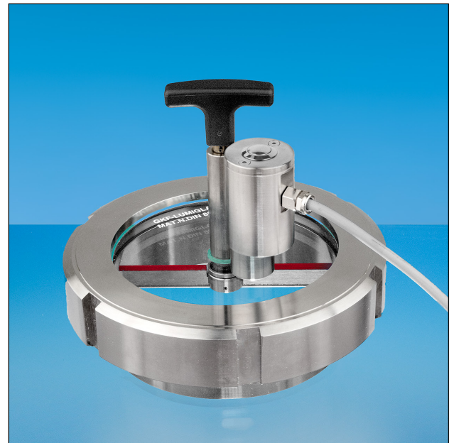
Lumistar Leuchte ESL 51-LED-HK im Einsatz auf einer Schraub-Schauglas-Armatur mit Lumiglas Scheibenwischer SW I