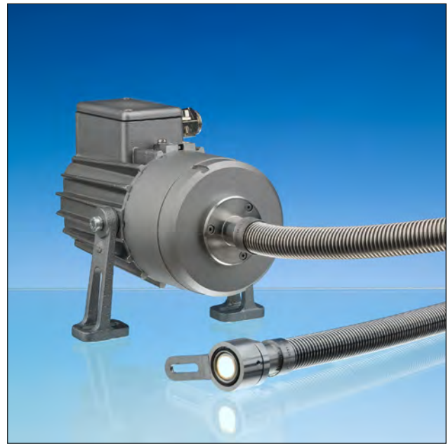
Lumistar Leuchte Lumiflex USL 07 ALF-Ex