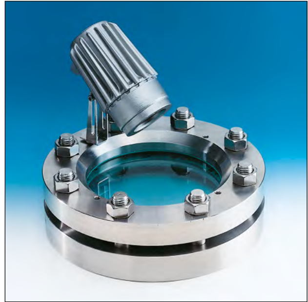
Lumistar Leuchte USL 05 Einsatz als Kombination von Sicht- und Lichtglas auf einer Schauglas-Armatur nach DIN 28120; Montage über Klappscharnier