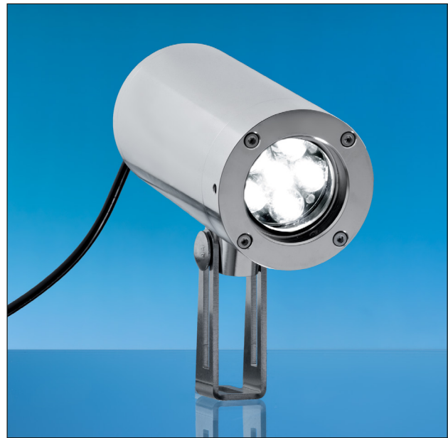
Lumistar Leuchte ESL 55-LED-Ex